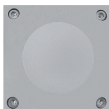
CODE : LJLS01 version une fenêtre one side version